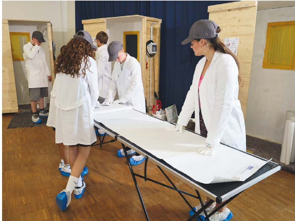
Bild 2: Schüler:innen der 9. Klasse arbeiten an einem Tapeziertisch und lernen dabei mehr als handwerkliche Fertigkeiten.

Die Schülerin Dijana war von Anfang an dabei. Sie sagt: „ Ich hatte sehr viel Spaß und habe auch viel Neues gelernt. Ich würde es auch sehr weiterempfehlen, sodass die anderen auch eine Chance haben, so etwas Cooles und Wunderbares zu erleben. “ Auch Jenna begleitet das Projekt seit Beginn: „ Ich fand das Tapezieren der Kabinen sehr gut und