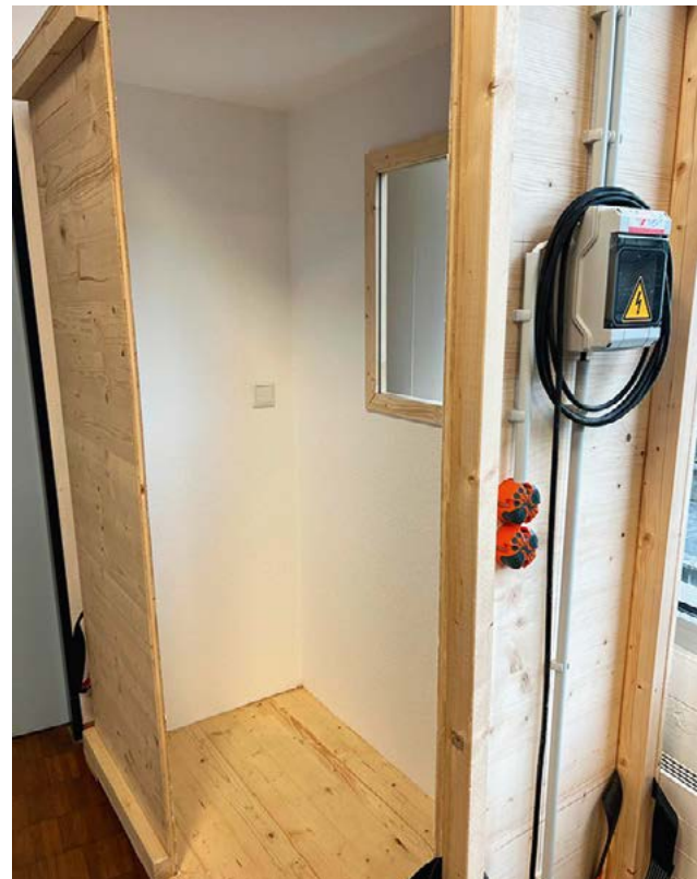
Bild 3: Eine fachgerecht verlegte Elektrik, selbstverständlich mit einem FI-Schalter versehen, ermöglicht einen gleichermaßen praxisnahen wie sicheren Einblick in Grundlagen der Elektroinstallation.

Eva Lang ist als Verwaltungsfachangestellte an der Merianschule Seligenstadt tätig und unterstützt in ihrer Funktion die Schulleitung.