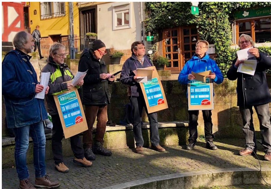
Aktion mit Abrüstungs-Quizz. Augustinertreppe Marburg, 18.11.2019

Eine neue Sicherheitspolitik, die die Sicherheit des Anderen zur gleichwertigen Bedingung macht, ist notwendig, wenn weltweit Abrüstung organisiert werden soll - und nur so wären die Aufgaben des ökologischen Umbaus nachhaltig zu finanzieren! Das wird aktuell aufgezeigt von dem von uns aufgegriffenen Szenario der Badischen Landeskirche: „Sicherheit neu denken: Von der militärischen zur zivilen Sicherheitspolitik“. ( http://www.ekiba.de/friedensszenario )