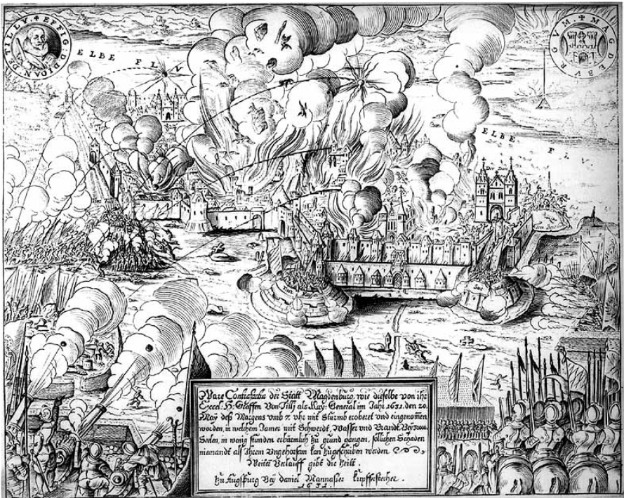
Zerstörung Magdeburgs 1631. Kupferstich von D. Manasser, 1632

Der Krieg um die Vorherrschaft europäischer Herrscherhäuser, deklariert als Religionsstreit, grub sich mit der Verwüstung der ausgeplünderten Siedlungen und ihrer angrenzenden Waldbestände sowie großer Teile der Agrarflächen langanhaltend in das Gedächtnis der Menschen und ebenso tief als Wunde in die Umwelt ein. Es dauerte weit über 100 Jahre, bis Mitteleuropa sich von diesem kollektiven Wahnsinn einigermaßen erholte