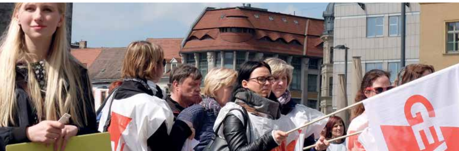
Beschäftigte beim Warnstreik 2016 in Halle (Saale)

Die Beschäftigten wünschen sich nicht nur eine faire Bezahlung, sondern umfassend gute Arbeitsbedingungen. In Zeiten des Fachkräftemangels und wachsenden Anforderungen an den öffentlichen Dienst erleben sie eine zunehmende Entgrenzung ihrer Arbeitszeiten, Stress und Arbeitsverdichtung. Sie fordern eine aufgabengerechte Personalausstattung, wirksame Maßnahmen zum Gesundheitsschutz und Entlastungen für ältere Beschäftigte. Sie fordern Anerkennung und Wertschätzung für ihre Arbeit. All dies sind wichtige Themen, für die sich die GEW unermüdlich stark macht. Nicht alle diese berechtigten Anliegen können tariflich geregelt werden (siehe Kasten auf Seite 4). Die Themen, die tariflich gelöst werden können, nehmen die Gewerkschaften mit in die Tarifverhandlungen. Streiken können wir diesmal nur für die Forderung nach sechs Prozent mehr Gehalt, mindestens aber 200 Euro. Für die weiteren Forderungen besteht Friedenspflicht. Das Ziel, die Arbeitsbedingungen insgesamt zu verbessern, verlieren wir trotzdem nicht aus den Augen. Ein Beispiel dafür ist unser Engagement, in der Politik Mitstreiter/innen für ein echtes Kita-Qualitätsgesetz zu finden.