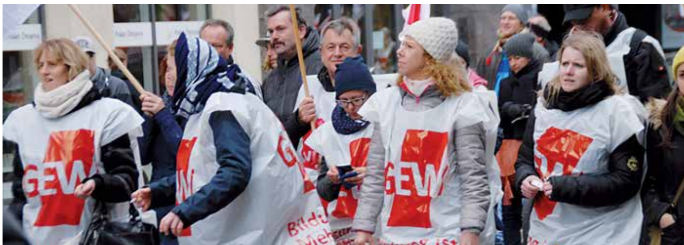
Kommunale Lehrkräfte beim Warnstreik 2016 in München

Die Verhandlungen beginnen am 26. Februar. An dem Treffen nehmen der Bundesinnenminister, die Spitze der Vereinigung der kommunalen Arbeitgeberverbände (VKA) sowie auf Arbeitnehmerseite die Verhandlungsführer von ver.di, GEW, GdP, IG BAU und dbb teil. Weitere Verhandlungsrunden sind für den 12./13. März und den 15./16. April geplant.