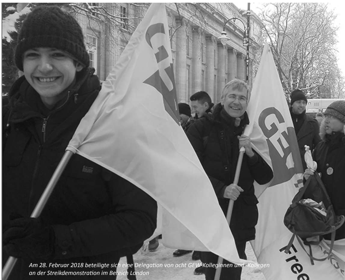
Am 28. Februar 2018 beteiligte sich eine Delegation von acht GEW-Kolleginnen und -Kollegen an der Streikdemonstration im Bereich London

che Picket Officers für die Bestreikung „ihrer“ Einrichtung sorgten. Bei Redaktionsschluss deutete sich an, dass die Streikbewegung erfolgreich war.