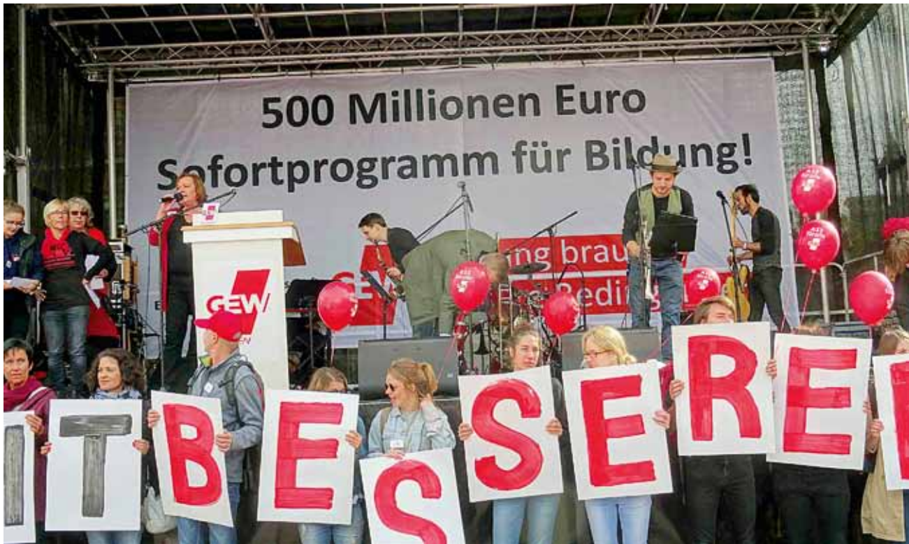
Frankfurt, 22.9.2018