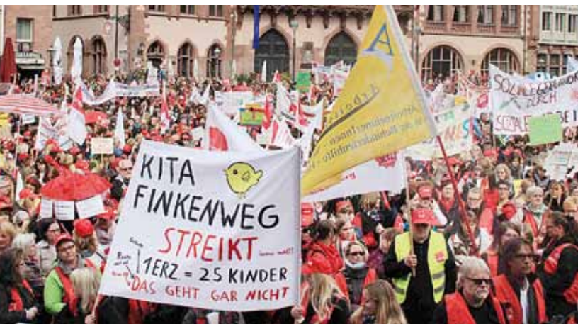
Frankfurt, 11. Mai 2015

Die GRÜNEN: Alle Untersuchungen zeigen, dass die Ausbildung und der Beruf insgesamt attraktiver werden müssen. Dazu gehören eine gute und gerechte Bezahlung, weniger Belastung im Arbeitsalltag und eine angemessene und attraktive Ausbildung. Wir GRÜNE fordern die Tarifpartner auf, die Arbeit von Erzieher*innen besser zu vergüten. Mit allen Akteuren und Expert*innen des Bereiches werden wir versuchen, die Ausbildungszeit zu verkürzen. Die derzeit laufenden Versuche der dualen Ausbildung für den Erzieherberuf wollen wir auswerten, um das Programm hessenweit stärker anzubieten. (...)