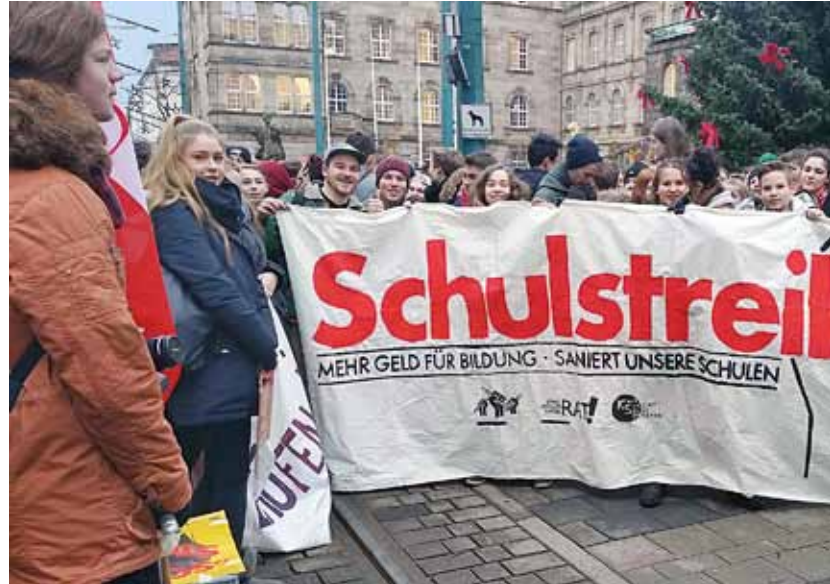
Kassel, 11.12.2017

FDP: Wir haben bereits bei den Haushaltsberatungen zum Haushalt 2017 ein Investitionsprogramm von 100 Millionen Euro für die Investitionen in Schulen gefordert. Dies wurde von der schwarzgrünen Koalition abgelehnt. Zwischenzeitlich wurden dann die Mittel des Bundes aus dem Kommunalinvestitionspaket II, die ausschließlich für Schulbauten zur Verfügung stehen, an die Kommunen weitergeleitet. Wir wollen diesen Weg fortsetzen und die Schulträger auch weiter bei ihrer wichtigen Aufgabe unterstützen. (...)