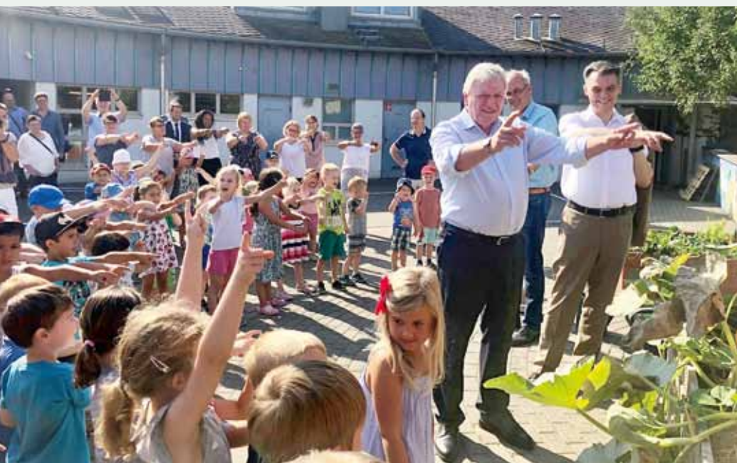
Ministerpräsident Volker Bouffier (CDU) zu Besuch in der städtischen Kita „Trauminsel“

In den EGO-Tarifverträgen von 2009 und 2015 haben Erzieherinnen und Erzieher einen guten Schritt in diese Richtung getan und die Öffentlichkeit für den Widerspruch zwischen gesellschaftlichem Wert und materieller Bewertung der Arbeit sensibilisiert. In der Fachkräftenot zu einer Verkürzung der