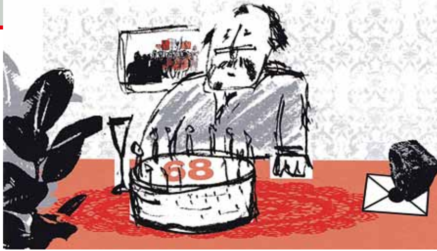
Illustration: Träger & Träger

„Demokratie ist die einzige politische verfasste Gesellschaftsordnung, die gelernt werden muss - nicht ein für allemal, so als könnte man sich einen gesicherten Regelbestand anlegen, der fürs ganze Leben ausreicht, sondern stets aufs Neue,