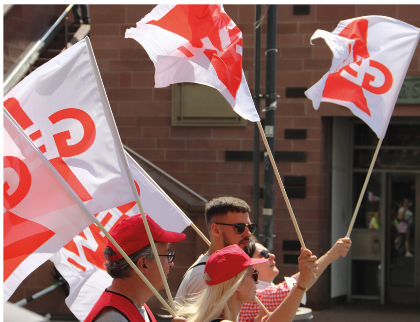
Warnstreik am 12. Mai 2022, Frankfurt am Main

Ab Inkrafttreten der Lehrkräfte-Entgeltordnung am 1. August 2022 werden neu Eingestellte automatisch nach dieser eingruppiert. Für bereits Beschäftigte beginnt dann eine einjährige Frist, innerhalb der sie eine neue Eingruppierung beantragen können. „Altbeschäftigte“, die keinen Antrag stellen, verbleiben für die Dauer der ununterbrochenen Tätigkeit in der alten Eingruppierung. Die GEW wird dazu auf ihrer Homepage informieren und geeignete Formulare zur Verfügung stellen. Unsere Personalräte sowie die regionale Rechtsberatung stehen allen betroffenen GEW-Mitgliedern gerne unterstützend zur Seite.